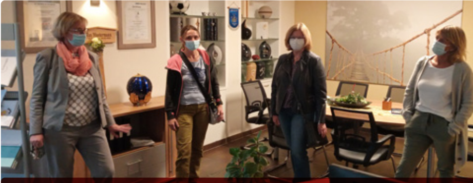
Interessierte hatten im Rahmen der 8. Bouser Hospizwochen die Möglichkeit, das Beerdigungsinstitut Avalon in Völklingen zu besuchen.

8. Auflage der Bouser Hospizwochen fand im September statt