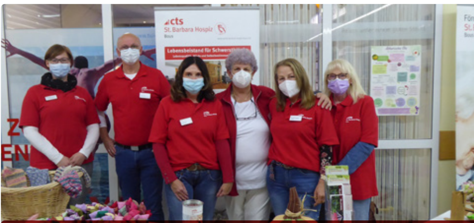
Zum Welthospiztag präsentierte sich das Team des Sankt Barbara Hospizes mit einem Informationsstand in der Passage des EinkaufCenter Bous.

Der Förderverein und das Team des Sankt Barbara Hospizes freuen sich, dass das Interesse an den Veranstaltungen erneut so groß war. Das zeigt, dass sie mit den Bestrebungen, die Themen Tod und Sterben in die Öffentlichkeit zu tragen, auf dem richtigen Weg sind.